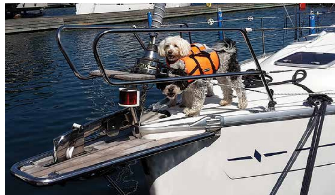
De här fina skeppshundarna kunde man se i Kalmar hamn en vacker sommardag.